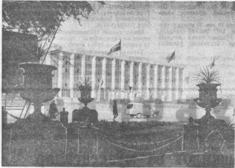
КИШИНЕВ, Галаба майдони.