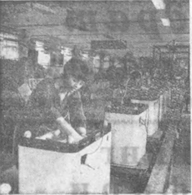
Кишинёвдаги «Электромашина» заводи. Кир ювиш машиналарини конвейерда йиғиш пайти.