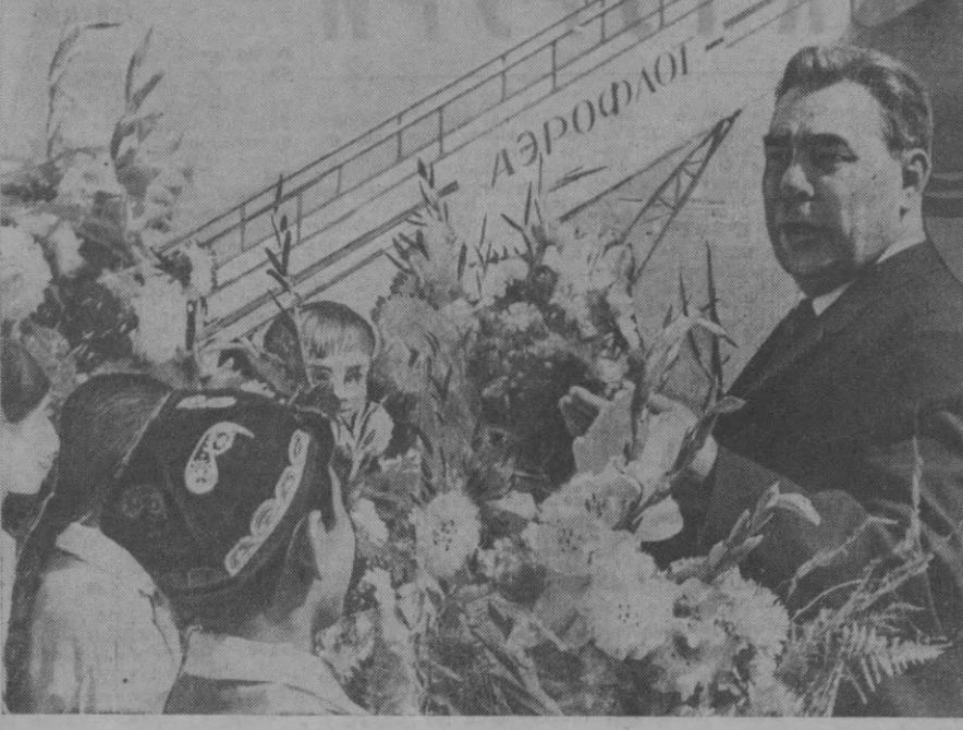
КПСС Марказий Комитетининг Бош секретари ўртоқ Л. И. Брежневни Тошкент аэропортида кузатиш пайти.