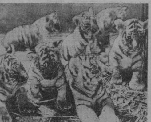
ГДР. Ростокдаги ҳайвонот босғи ўзининг рекорд муваффақияти билан ҳурурланса аризи. У ерда Банга лақабли йўлбар май ойда етита бола туғди...