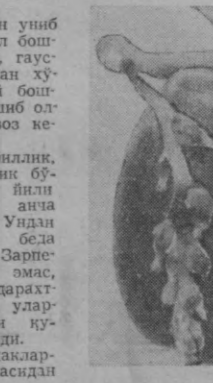
Ҳ. ПРАТОВ, табиатшунос.

амас, меваси ҳисобига яшайдиган турини учратдик. Сиз расида кўриб турган олхўри мевасига ёпишиб олган текинхўр зарарчак Ҳсимлик орқали мевасига ўтган. Қузатишлар мева дарахдан узиб олингандан кейин ҳам зарарчак мева ҳисобига ўсишни давом эттиришни кўрсати. У ҳозир ҳам ўсиб турибди.