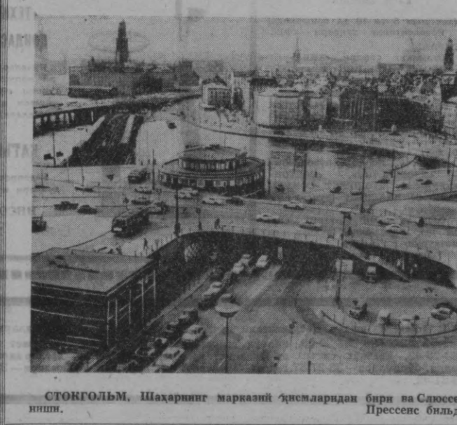
СТОРГОЛЬМ, Шаҳарнинг марказий қисмларидан бири ва Сьюссен майдонининг куриши.

ХАНОЙ. Американинг Вьетнамдаги жиноятларини текширувчи комиссия эълон қилган ахборотда айтилишича, Американинг разведкачи самолётлари шу йил август ойи мубайида Вьетнам Демократик Республикасининг осмон чеғарасини 2.660 марта бузиб ўтган. Шу вақт ичиде, дейилади ахборот