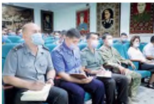
Ҳозирги шиддат билан ривожланиб бораётган ахборот

Шу мақсадда Ўзбекистон Республикаси Қуролли Кучлари давлат музейида ҳарбий психологлар учун ўқув-услубий йиғин бўлиб ўтди. Унда жанговар тажрибаларга эга бўлган офицерлар, амалиётчи психологлар ҳамда Мудофаа вазирлиги масъуллари иштирок этди. Жанговар ҳолатлар фото-видеолар орқали намойиш этилди ва бундай жараёнларда ҳарбий психологлар томонидан эътибор қаратилиши керак бўлган вазиятларга тўхталди.