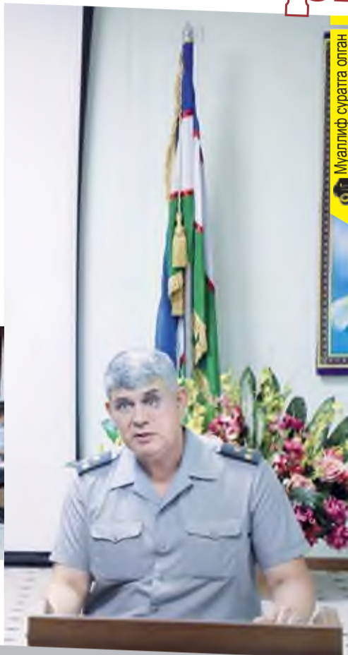
Муаллиф сурагга олган

асрида «ақл ва кўнгилнинг олтин ўрталиги»ни топиб, унда ҳаракат қилишга ундовчи касб эгалари бўлмиш психологларга қўйилган талаб катта. Айниқса у ҳарбий психолог бўлса, унга юкланадиган юклама бир неча баробар залворли бўлиши табиий. Зеро, Ватан сарҳадларини қўриқлаб, халқнинг тинчлигини сақлаб турган посбонларимиз руҳиятини кўтаришдек шарафли ишга бел боғлаган ҳарбий психологларнинг ҳам ўтказилаётган ўқув-услубий йиғиндан руҳияти кўтарилди. Ўзлари учун керакли тавсия ва кўникмаларни олишди.