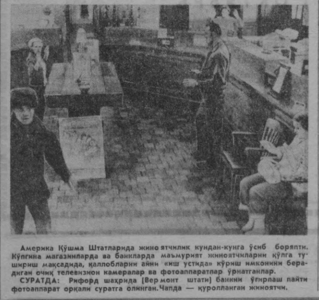
Америка Қўшма Штатларида жиноятчилик кундан-кунга ўсиб борапти. Кўнгила мағаниларда ва банисларда маъмурият жиноятчиларни қўлга тушириш мақсадида, қаллобларни ақин еш устидан қўриш иккинчи берадиган очик телевизион шаҳарлар ва фотоаппаратлар урнатилган. СУРАТДА: Рифорд камерида (Вермонт штати) банини ўғирлаш пайти фотоаппарат орқали суратга олинган. Чапда — қуролланган жиноятчи.

БОНН. Реваншчи таъкилот бўлган «Шарий» Германия ер эгалари бирлиги маъси, бу ерда Германия шарқининг қонуни чикараган миллий маълумис деган ном остида йиғин ўтказди. Бирлашманинг бошлиқларидан бири бўлган Гюнтер Хофман йиғинда сўзга чиқиб, Совет—Ғарбий Германия шартномасининг ратификация қилинишига ва амалга оширилишига қаттиқ қаршилик кўрсатишга даъват этди. Реваншчилар ўз талабларини амалга ошириш мақсадида «Германия шарқининг муваққат маъмуриятининг таъсис этидилар. Улар қабул қилган китобномада «1939 йил 31 августга маъжуд бўлган чегаралар» доғрасидаги ерлар Германия рейхига қайтариб берилиши, деб талаб қилдилар. (ТАСС).