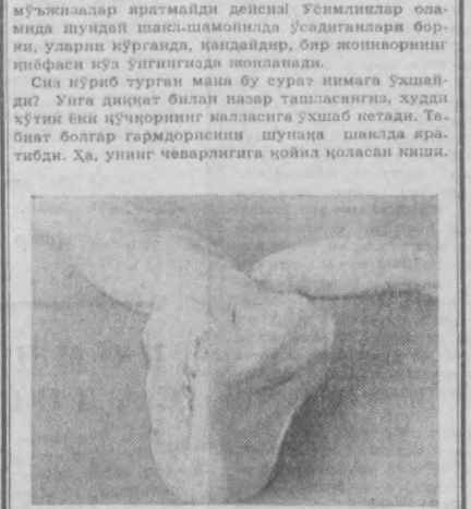
Табиат ҳар нарсага қодир. У ўз бағрида не-не мўъжизалар яратмайди дегенига ўсимликлар оламида шундай шай-шайлар ҳам ўсди. Шохдор гармдори, бу янги сортнинг кўчи ёзилиши мумкин. Ҳар қанақа рақам ва нидекларни бир-биридан фарқ қила олиши керак. Ваҳолакин, миллион миллион кишилар бу рақам ва нидекларни турлича ёзадилар. Рақамларнинг кенглиги, сиёҳнинг ва пастанинг ранги автоматик сараловчи машинага таъсир қилади, йўқми, буни билиш муҳимдир.