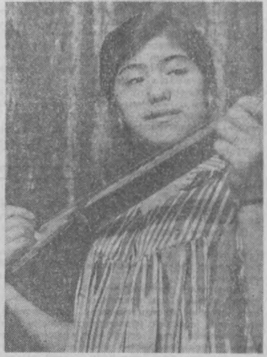
Куйлайди она меҳрини Қўлда рубоби билан.

Гарбий германиялик ҳаваскор селекционер никотинсиз тамаки чекишни маслаҳат бермоқда. У беш йиллик тежрибадан сўнг, мутлақо никотинсиз тамаки сортини топди. Гап шундаки, тамакининг мезаси ва ҳиди ўзгарган. Бу чекувчиларга ёқармикини?