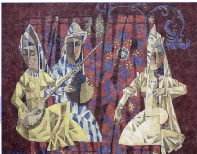
Хуршид Зиёхонов. «Музыка»