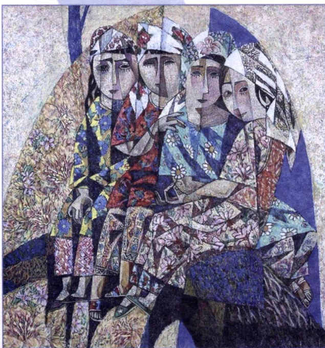
Хуршид Зиёхонов. «Романтика»