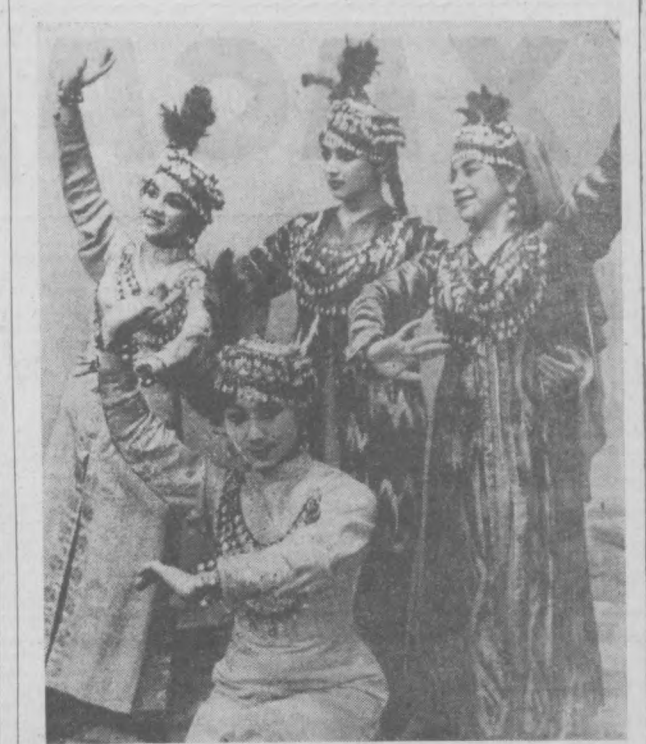
М. Қорнқубой номи ўзбек Давлат филармонияси ҳошида Хоразм ашула ва рақс ансамблининг ташкил этилганга яқинда бир йил тўлди. Суратда: Ансамблининг бир срупа ёш таланти рақосалари Ҳива рақосини ижро этмоқда.