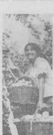
МОЛДАВИЯ ССР. Тираспольдаги Фрунзе номидаги мовачилик ва сабзавотчилик совхоз-техникумининг боғларида бу йил мўл ҳосил еттиштирилди. Совхоз-техникум ўқувчилари ҳар гектар ердан 125 центнердан олма йиғиштириб олишга аҳд қилган эдилар. Мажибурият ортими билан адо этилганига қарамай, ҳосил хали кўп. Ҳар куни ҳўжалик савдо ташкилотларига ўйлаб тонна мева жўнатмоқда.