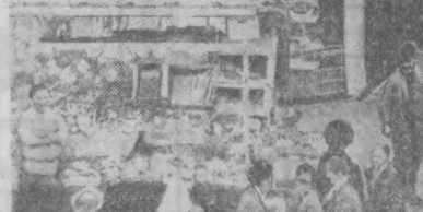
ЛОНДОН. Англия пойтахтининг кўчаларида ахлат уюмлари кун сайин кўпайиб бормоқда. Бунинг сабаби шунки, иш ҳақининг оширилишини талаб қилаётган муниципал ишчиларнинг иш ташлаши уч ҳафтадан бери давом этяпти.

Буюк Британия Коммунистик партиясининг Бош секретари Жон Голлан Ноттингемда бўлган митингда сўзга чиқиб бундай деди: «Консерватив хукумат насаба союзуларининг хукуқларини йўқ қилишга уринмоқда, иш ҳақининг оширилишига йўл қўймаётми; Ваҳолан-