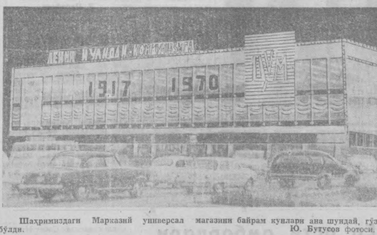
Шаҳримиздаги Марказий уннверсал магазини байрам кунлари ана шундай, гўзал бўлди.