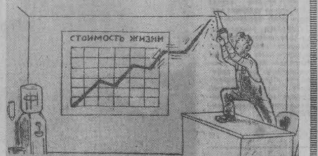
Навбатдаги нарх-назонинг оширилишига тайёргарлик.

Капиталистик мамлакатларда меҳнаткашларнинг иш ҳақи ўз эътиёжларини тобора қопламайдиган даражада камайиб бормоқда. (Газетадан).