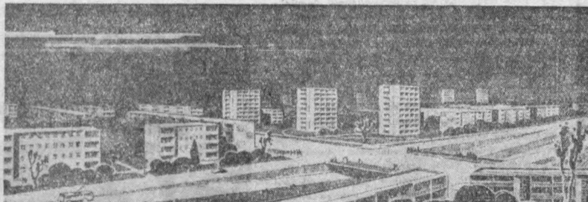
«Шимол» турар жой райондаги ювсақ бинолар қурилиши.

МАССИВДА парклар, боғлар ва хиёбонлар, йирик сув ҳовзалари учун ажратилган майдонларда жамоат бинолари ва бошқа иншоотлар барпо этилиши инженерлик ишларига кўпгина маблағ сарфлашни талаб этади. Мавжуд кўчаларда, дарактёрлар, шу жумладан 20 гектарга яқин майдондаги мевозор бег сақлаб қолинади. Бу кўчаларда ва боғлар массивнинг умумий ободончилигига бир ҳусн бўлиб қўшилади.