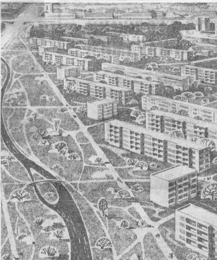
Биринчи навбатда қуриладиган микрорайонлардан бири ана шундай бўлади.

МАССИВДА қатор маиший хизмат муассасалари (савдо, медицина, коммунал хизмат ташкилотлари) қурилиб, бу ташкилотларда минглаб ишга жойлаштирилади. Массивдаги маиший хизмат тармоқларининг ўзи-