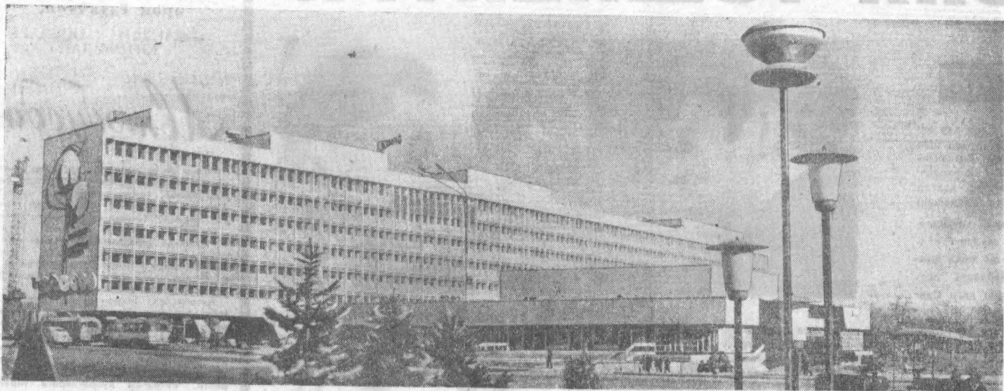
СУРАТДА: Ўзбекистон ССР Министрлар Совети учун қурилган бино.