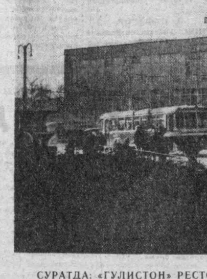
СУРАТДА: «ГУЛИСТОН» РЕСТОРАНИ.

Бу йил бир қатор янги хил материалларни қурилишга жорий этдик. Ойнали плитус, гипсанд таёбланган блоқлар кўплаб ёғоч материалларни тежашга ёрдам берди.