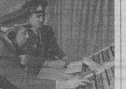
Тошкент шаҳар микроян комитети Ички ишлар бошқармаси профилактика бўлими матбуот гуруписининг ходими А. Еськов ва «Тошкент оқшом» газетасининг ходими В. Емельянцева олиб борди.