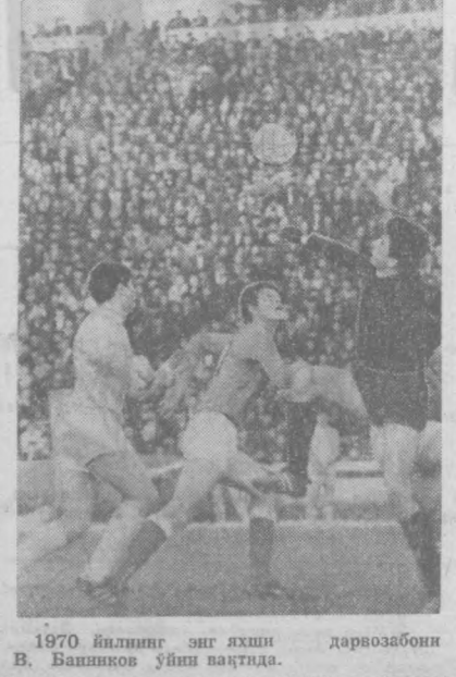
1970 йилнинг энг яхши дарвозабони В. Банников ўйнаётганда.

Бу йилги чемпионатда «Торпедо» (Москва) командасининг дарвозабони Виктор Банников энг яхши дарвозабон номини олди.