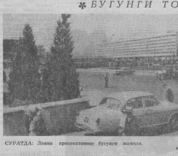
СУРАТДА: Ленин проспектининг бугунги жамоли.

ДАВЛАТ АРБОБИНИНГ СИЙМОСИ Бундан беш йил муқаддам Тошкентда бўлиб ўтган Хиндистон ва Покистон давлат бошларининг учрашуви тарихий воягача айланди. Бу учрашудда Хиндистон Бош вазири Лал Бахадур Шастри ва Покистон президенти М. Аюбон икки мамлакат ўртасидаги харбий можароларни бартараф этадиган тинчлик декларациясига ийзо чекдилар. Тинчлик ишига муносиб хисса қўшган атоқли давлат арбоби Л. Шастри хотирасига бағишлаб шаҳримиздаги кўчалардан бири унинг номига қўйилди. Ҳозирги пайтда бу кўчада чиройли бинолар қад кўтарилмоқда. Ана шу кўчада Хиндистон давлат арбобининг сиёсий акс этилгандай ҳайкал ҳам ўрнатилди. Ҳайкалтарош Я. Шапиро Шастрининг образини яратиб устидаги ишларини илҳосига етказди Бүгүн вагонларга ортилган бир неча юз тонна олма марказий шаҳарларга юқатилди. Улар Москва ва Ленинград ҳамда Урал ва Сибирнинг меҳнаткорларига аталди. Куз ҳосилини жуғайтиришда Оржоникидзе ва Калинин районидagi хўжалиқларнинг деҳқонлари ҳиммат кўрсатдилар. Бундан ташқари, мавсумда қўл шакарлар, та 48 миң тонна қовун-теревуз ҳам юборилди.