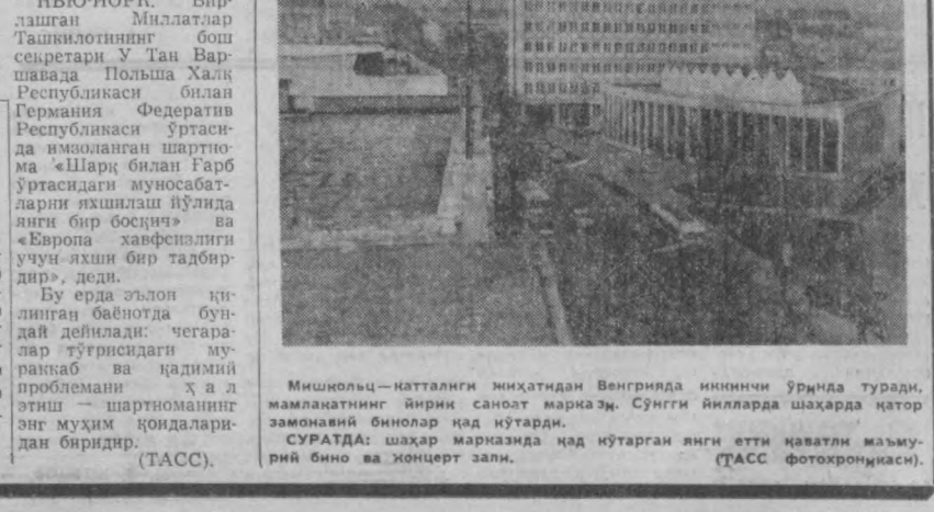
Мишлюць — катталиги миҳатидан Венгрияда инининчи ўрнда туради, мамлакатнинг йиринчи саноат маркази. Сўнгги йилларда шаҳарда янги замонавий бинолар қад кўтарди. СУРАТДА: шаҳар марказида қад қўтарган янги етти қаватли маъмурий бино ва концерт зали.

«Ўзбекистон узоқ ва яқин ўлкадир! Орамизда минглаб километр масофа бор. Қачонлариди ота-боболаримиз бир-бирларга қўшни бўлишган. Амалдорларимиз Орол денгиз атрофидаги қўллар оша янги ерлар, янги тақдир ва бахт-содатни излаб ана шу ўлкага боришган. Оравдан қанча суварлар оқиб ўтди. Лекин бу ҳаётга неча-неча асрлардан кейин эришилди. Ана шу ҳаёт бошланганда кейин узоқ Осиёда бизнинг энг яқин ва самимий дўстларимиз болгарликни биллиб олди...»