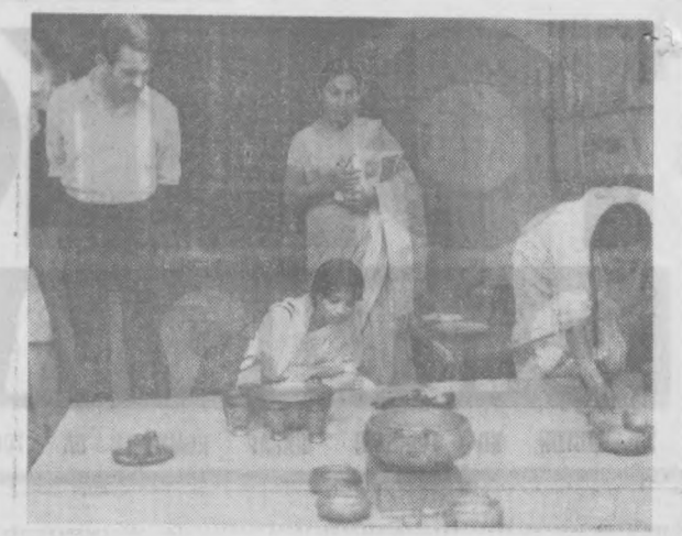
Деҳли. Ҳиндистоннинг пойтахтида Россия Федерациясининг амалий санъат кўргазмаси очилди. СУРАТДА: кўргазма залида.

Ўзбекистондан келган меҳмонлар Ироқда отти кун бўлиб, мамлакатнинг диққатга сазовор тарихий жойлари билан танишдилар. Совет Иттифоқида шарқшуносликни ривожлантириш тўғрисида лекциялар ўқийдилар.