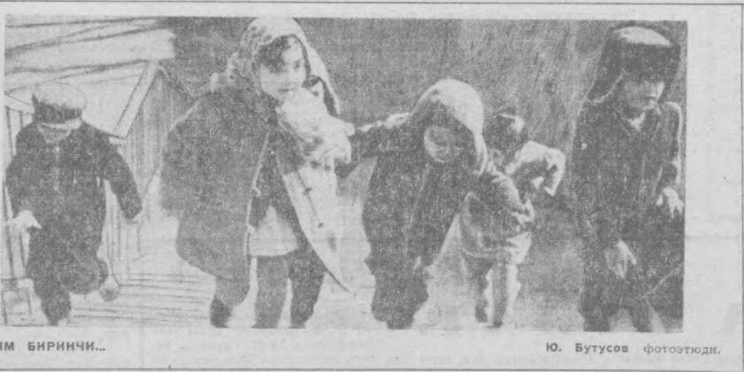
КИМ БИРИНЧИ...