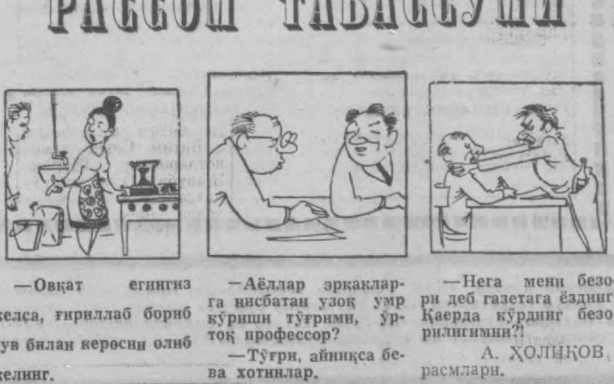
— Овқат егингиз келса, гирллаб бориб сув билан керосин олиб келинг.