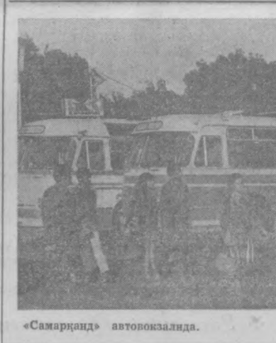
«Самарқанд» автопоказида.

Ҳозир 1 ва 2-трамвай ҳамда троллейбус деполарида 60 дан ортиқ «пўлат от» суворийлари таълим оляпти. Улар февраль ойида курсларни тамомлашди.