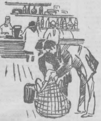
Шу кунларда магазинлар айниқса тавжжу.