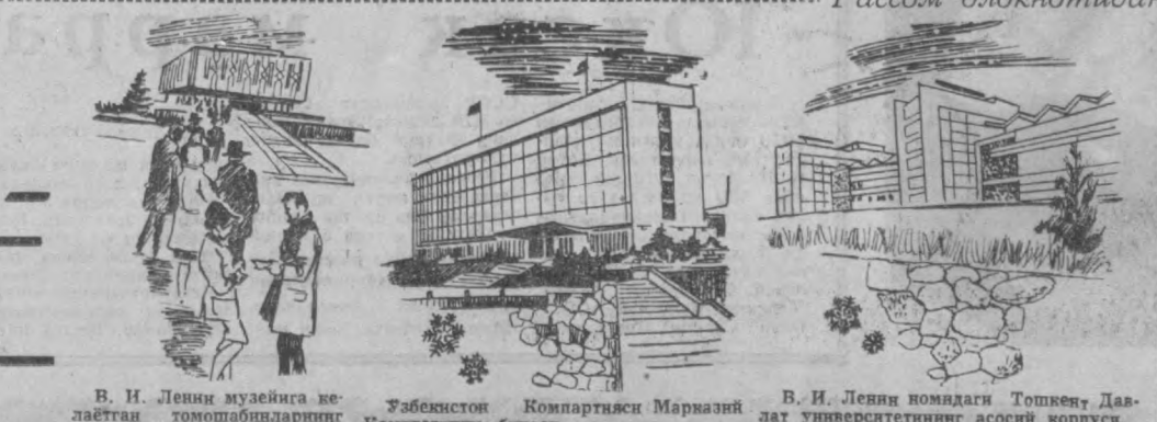
В. И. Ленин музейига келаятган томошабинларнинг оқими узайтмайди. Ўзбекистон Компартияси Марказий Комитетининг биноси. В. И. Ленин номидagi Тошкент Давлат университетининг асосий корпуси. З. Лелявская расмлари.