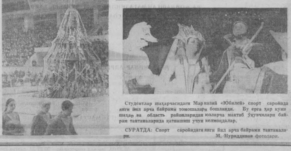
Студентлар шаҳарчасидаги Марказий «Юбилей» спорт саройида янги йил арча байрами томошалари бошланди. Бу ерда ҳар кун шаҳар ва обаласт районларидан юзларча мактаб ўқувчилари байрам тантаналарида қатнашши учун келмоқдалар.

СУРАТДА: Спорт саройидан янги йил арча байрами тантаналари.