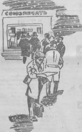
Газетларда қандай янгилик бор экан?