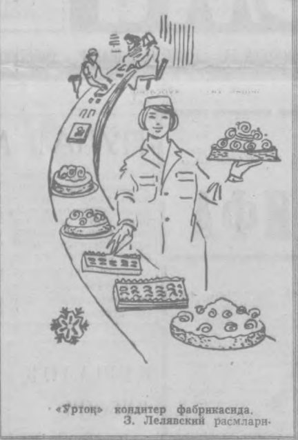
«Ўртоқ» кондитер фабрикасида. З. Леляевский расмлари.