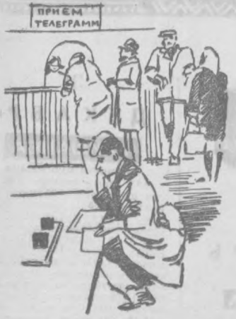
Сунгит табрик телеграммалари тобора кўпаяди.