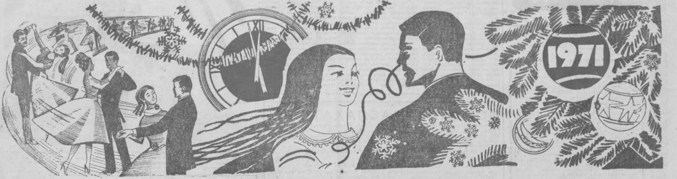
З. Лелаяская расми.

Бу тунг гузаллигим бор латофатни Синдира олғайми энг тереги заи! Шо, севгим ва садоқатини, Истиқболни ва садоқатини, Ҳаётимиз кўрми, посбони аёл! Барқ уриб улангини, иораста насл, Отлар, таваруқ бўлсин ёшмигиз, Бахт, бахорини мангу ардоқлаб, Теланимизда мағрур чараклаб, Шўъла сочсин торлоқ Ой Кўёшининг, Олладан зулматлар сугрулб тамоқ, Тахтаи қилтис эзгулик ва нур, Янги йилни шодон қаршлаб, Унга меҳру дилни бағишлаб, Қадаҳ кўтарайли мағруру масрур. Жуманис ЖАББОРОВ.