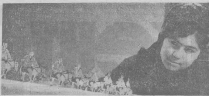
Кенг қирдан уловага минган йўловчилар келяпти. Уларни кузатиб турган соҳиб-жамоал қиз ширин хабар берилади.

Агар сўт ағиб қолган бўлса, уни ташлаб юбормасдан, хамирга ишлатса бўлади.