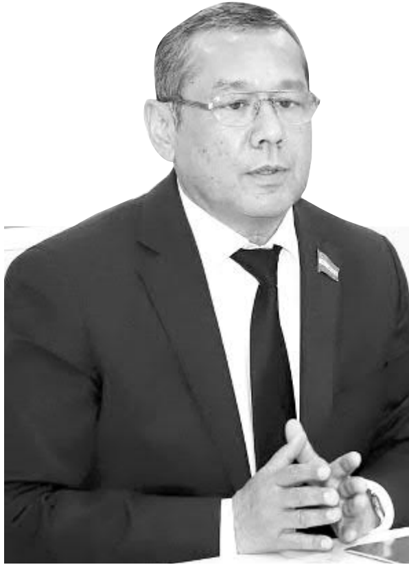
Улуғбек ИНОЯТОВ, Ўзбекистон Халқ демократик партияси Марказий Кенгаши раиси

Умумхалқ сайловлари орқали давлат ҳокимияти органларини шакллантириш демократик ҳуқуқий давлатнинг энг муҳим белгисидир.