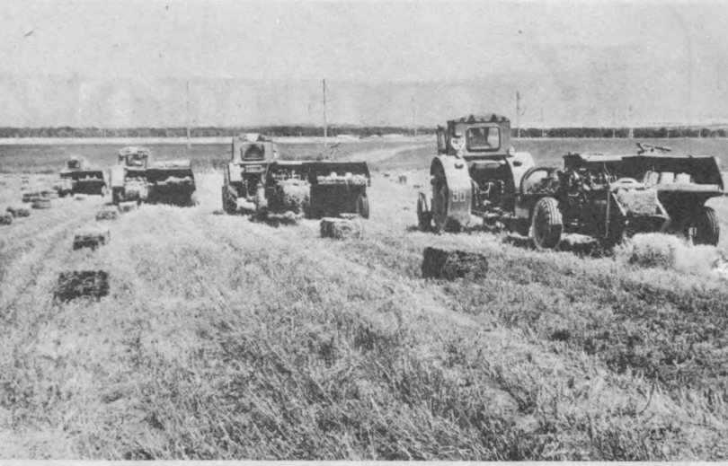
Булуғтур районидagi «Интернационал» совхози маъмурияти аҳолининг шахсий чорвасини ем-хашак билан таъминлашга доир жумҳурият Президенти фармонини сидқидил ижро этмоқда. Ҳўжаликда 235 гектар бедазор бор. Дехқонлар парваршини намуна илгала қўйиб, барча майдонларда мўл пичан ҳосил етиштирилди. Биринчи ўрим-