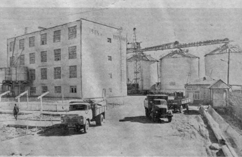
Ш. АЛИМОВ олган суратлар. (ЎзТАГ).

СУРАТЛАРДА: 1. Ком-бинатнинг умумий кўрини-ши. 2. Серурум ва замона-вий ускуналар билан жиҳоз-ланган ишлаб чиқариш жа-раёнларидан бири.