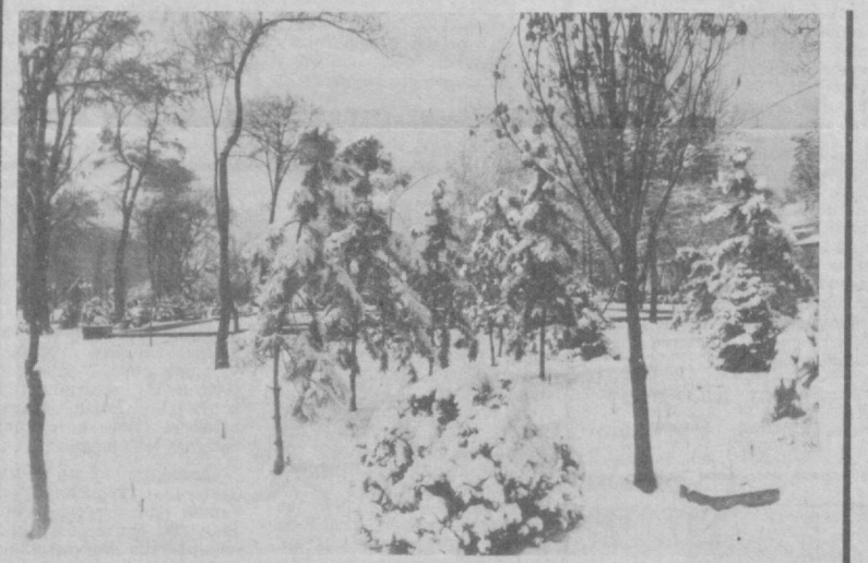
Осмон унин элади, Ҳаво тоза, бегубор.