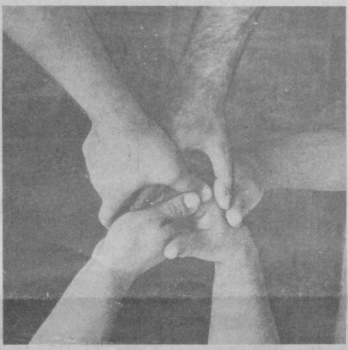
тараққиёт, бахт-саодат йўли

Ўзбекистон Республикаси Олий Кенгашининг ўн биринчи сессиясида таъкидлангандек, ўзбекларимизнинг бошқа халқларга муносабати ижобийдир. Юртимизда яшаётган бошқа халқ вакилларига одилона қараш, уларга меҳрибонлик қилиш биз учун маънавий бурчга айланган. Истиқболга эришган халқ ўзгаларга зўғум қилмайди. Биз таъини ва тақдирдан қўтилган, ўз қадрини билган халқимиз.