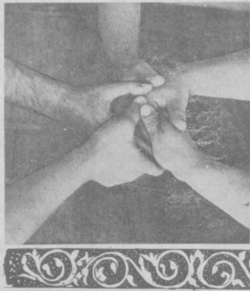
кали ҳарбий кадрлар бўлиб етишди.

Х ОРАЗМ — фалакнинг гирдиши билан бу заминга келиб, муқим яшаб қолган жуда кўп миллат вакилларига иккинчи она юрт бўлган кўҳна ва қадимий, бағри кенг, меҳри уммон, мурувватли макон днёр. Воҳа аҳли, айниқса хиваликлар ўз фарзандидек ардоқлаган. «Хусан афанди» дея алақаб, бошларига кўтарган турк фуқароси Хусан Исмонд ўғли ана шундай кишилардан бири эди.