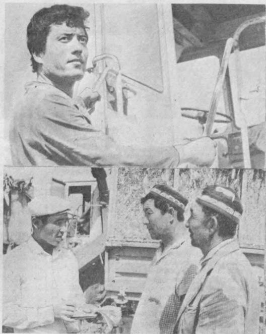
«УЧ ҚАҲРАМОН» ҚИШЛОВ ТАРАДУДИДА

М. ҚАЮМОВ, «Қишлоқ ҳақиқати»нинг махсус мухбири.