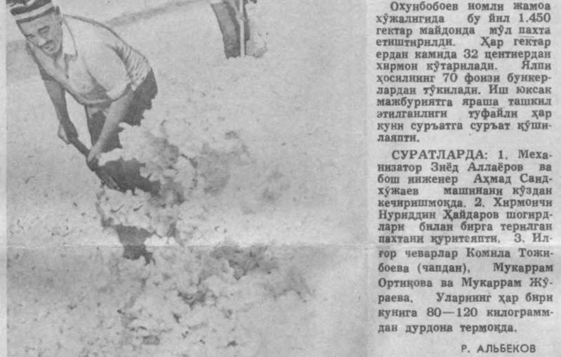
Охунбобоев номида жамоат хўжалигида бу йил 1.450 гектар майдонда мўл пахта етиштирилди. Ҳар гектар ердан камда 32 центнердан хирмон кўтарилди. Янги ҳосилнинг 70 фоизи бункерлардан тўқилди. Иш юқас мажбуриятга яраша ташкил этилганлиги туфайли ҳар куни суръатга суръат қўйилапти.