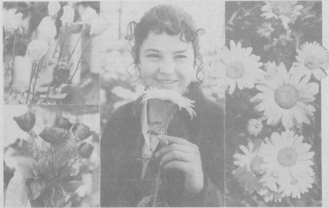
— Гулзордан гул уздим, гулим Сизгадир.

Ўзбекистон Республикасининг Президенти, И. ҚАРИМОВ.