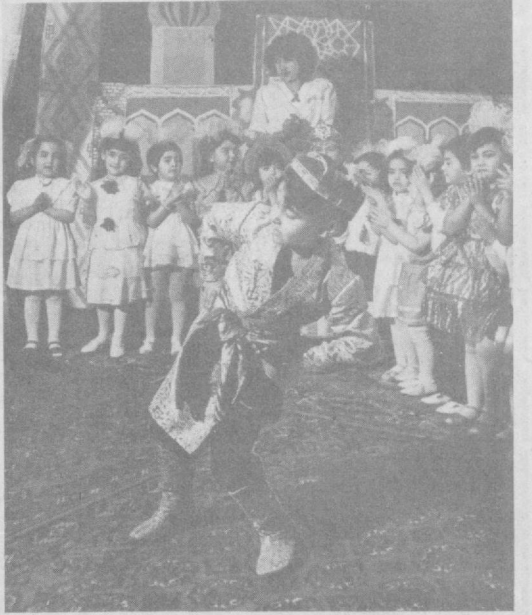
Қаранг, дилга бахш этар жон Андижоннинг полкисни. Чунки қўшиқ, рақсга қон Азиз Ўзбек ўлкаси.

Халқимиз чиндан ҳам ниҳоятда шoirфез, қувонқ, ижодкор халқ. Наврў қўшиқлари унинг ижод дегизида томган бир неча томчи, холос. Уларнинг азгу орзулари, яхши ниятлари, ширин хайлларини ақс эттирган бу қўшиқларга халқ бутун қалб қўриши, меҳрини, баҳорга, Наврўга бўлган муҳаббатини сингдирган.