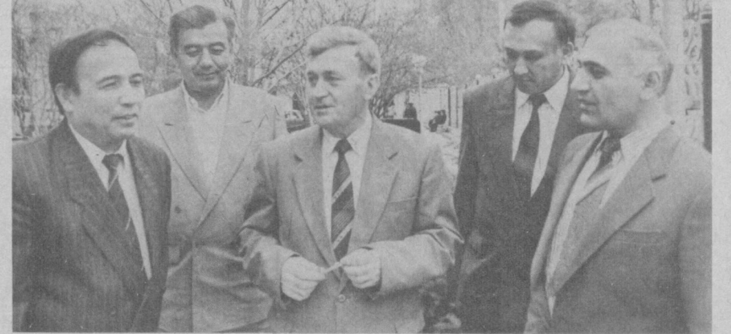
Юқориди ва қуйдаги суратларда съезд делегатларини кўриб турибсиз.

Съезд делегатлари ассоциация Уставини атофлича муҳокама қилдилар, кенгаш аъзоларини, тафтиш комиссиясини сайлайдилар, бошқа муҳим ҳужжатларни тасдиқлайдилар. Анжуман иштирокчилари Ўзбекистон Республикасини Президент И. Каримовнинг «Ўзбекистон Пахтани қайта ишлаш ва пахта маҳсулотини сотиш давлат акционерлик ассоциациясини ташкил этиш тўғрисида»ги Фармонида белгиланган вазифаларини бажариш, хусусан ягона илмий-техникавий сиебат ўтказиш, жаҳон талабларига мос келадиган маҳсулотлар етказиб берилишини таъминловчи замонавий технологияни кенг жорий этиш учун амалга оширилган тадбирлар хусусида сўз юритадилар, тармоқни ривожлантириш йўналишларини белгилаб оладилар.