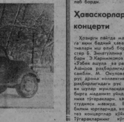
Шаҳар кўчалари қордан тозаланмоқда.