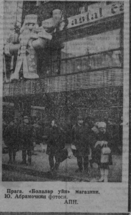
Прага. «Болалар уйи» магистрини

ПРАГА. (ТАСС). Чехословакия бинкорлари янги шаҳарлар, янги посёлкаларини барпо қилмоқдалар. Бу эса мамлакатдаги қадимий шаҳарларнинг қифасини ўзгартириб юборади. Чехословакия бинкорлари ўтган йилда қурилиш планини асосан мўддатидан илгари бажаришлар. Острава, Брно, Пльзень ва Чехиядаги бошқа шаҳарларнинг ишчи ҳамда кимматчилар неча ўн миңлаб янги квартиралар олдилар. Праганинг атрофида йирик уй-жой массивлари вужудга келди. Словакия бинкорлари уй-жой қурилиш планини мўддатидан илгари бажаришларини тўғрисида рапорт бердилар. Словакия Социалистик Республикасининг граждандари ўтган йилда 16 миңдон ортиқ янги квартиралар олдилар. Словакиянинг пойтахти Братислава янги уй-жойлари билан Прагадан қолдирилади. Шаҳардаги янги районларнинг панларини тўзатган архитекторлар ва мутахассислар Братиславанинг уй-жой фонди яқин ўн йил ичиде икки баравар ортади, деб мўйжалладилар. Республиканинг шарқда Кошице шаҳри қад кўтармоқда. Бу ерда шарқий словак индустриал гитантининг металлургия янги квартиралар олдилар. Республиканинг бошқа жойларида ҳам янги шаҳар ва уй-жой районлари вужудга келтирилди.