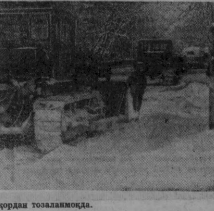
Шаҳар кўчалари қордан тозаланмоқда.