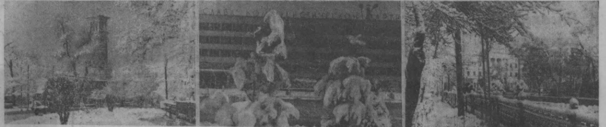
Тошкентда қалин қор ёғди. Ҳаммаёқ оппоқ момиқча ўхшайди. Бутун дов-дараклар шох-шаббаларини кўтаролмай қолди. Мана бу суратда сиз кўриб турган табиат олами ҳам гўё «салом» қилгипти. Қалин қор устида фарч-гурч қилиб юришининг ҳам ўзига хос гаши бор. Поштахт кўчаларида ана шундай манзара.