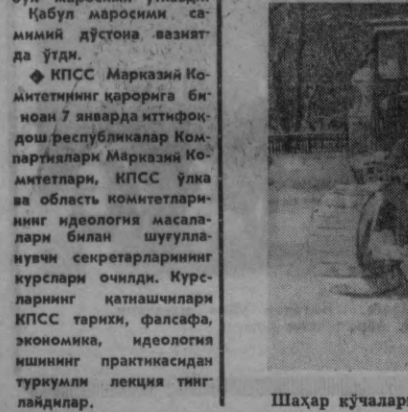
Шаҳар кўчалари қордан тозаланмоқда.

Шаҳримиздаги профессионал-техника билим юрлари ҳаваскорларининг бошқа шаҳарлардаги ўқув юрлари билан доим алоқа боғлаб туришди. Улар ўзаро таъриба алмашиш мақсадидан бир-бирларига ўқувчилар юборишди. Тошкентдаги бир қанча билим юрти ўқувчилари Ленинград, Киев ва бошқа шаҳарларга бериб келишган эди. Яқинда 9-билим юртига Магнитогорск шаҳридан 30 ўқувчи келди. Улар ўқувчиларининг фаолияти ва ўқишлари билан, шаҳримизнинг диққатга сазовор жойлари билан танишмоқдалар.