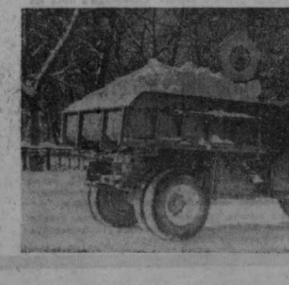
Шаҳар кўчалари қордан тозаланмоқда.