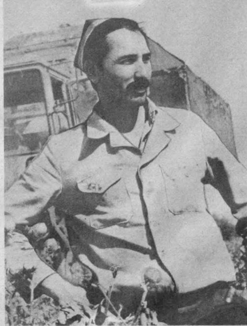
Ҳужумат заршунослари учинчи миллион тонна ҳисобга пахта топширмақдалар. Милليون тонна тош босадиган улкан хирмон беш иш кунда тикланди! Навбатдош дошон бундан ҳам шиддатлироқ эгалланиши шубҳасиз. Ҳуни меҳнат жараёнига қўриқ Сирдарё вилояти аъзолари ҳам астойдил енг шимариб киришди. Сирдарёлик дала гавдичиларнинг довури азалдан маълум: улар иш бошлашдики, хирмонларга барака киради.