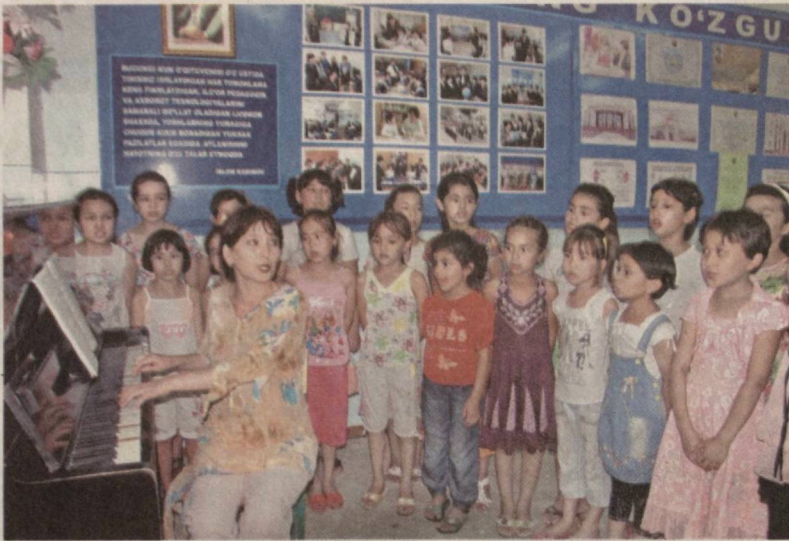
Ёз – ўтмоқда соз