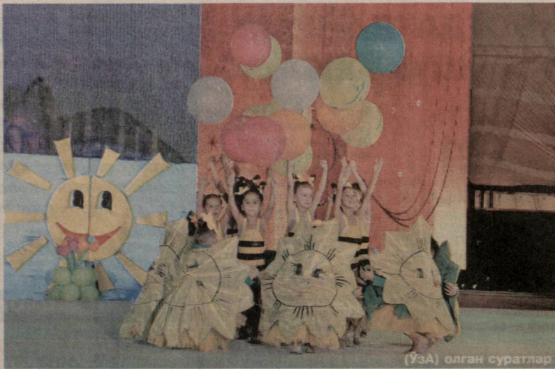
(ЎЗА) олган суратлар