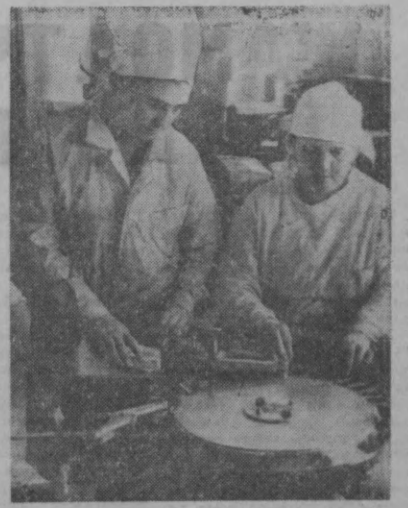
Тошкентдаги «Уртон» кондитер фабрикасининг қандолатчилари ҳар кун эл дастурхонига 175 номда турли хил кондитер маҳсулотлари ишлаб чиқаради.