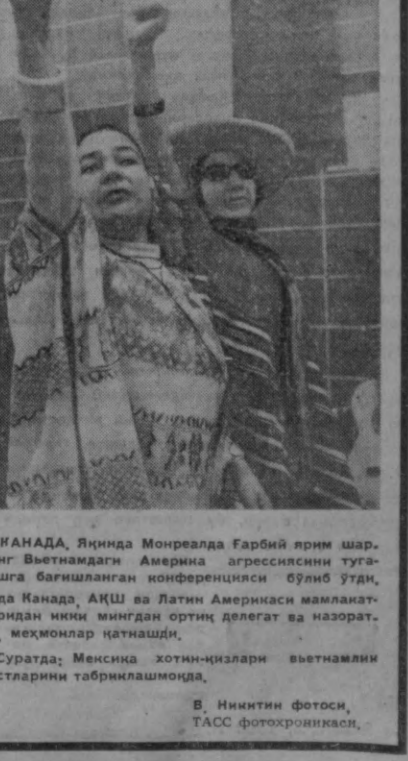
НАНАДА, Яқинда Монреалда Ғарбий ярим шарнинг Вьетнамдаги Америка агрессиясини тугатишга бағишланган конференцияси бўлиб ўтди. Унда Канада, АҚШ ва Латин Америкаси мамлакатларидан икки миңдан ортиқ делегат ва назоратчи, меҳмонлар итгнашди. Суратда: Мексика хотин-қизлари вьетнамлик дўстларини табриқлашмоқда.

дорда жарима тўлашга ҳўкм қилинган эди. Улар «ешларни ҳарбий хизматдан бош тортишга ундаш мақсадидаги фитнага хайрихоҳ бўлиш»да айбланган эдилар. Спок ва унинг сафдошларининг ҳимоячилари ҳозирги вақтда айбдорларнинг Американинг Вьетнамдаги сибатини ва АҚШдаги ҳарбий хизматга чакриқчи системасини танқид қилишлари мамлакат конституциясига хилоф эмаслигига асосланб, ҳўкмин ўзгартириш учун ҳаракат қилмоқдалар.