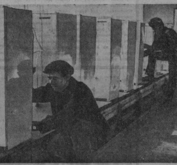
В. И. Ленин туғилган кунининг 100 йиллиги шарафига юксак мажбуриятлар олган рўзгор холодильниклари заводи коллективи шу кунларда юксак кўтариш билан меҳнат қилмоқда. СУРАТДА: йиғув цехининг конвейери.

Меҳнат Қизил Байроқ ордени ўзбек давлат филармонияси «Шодлик» ансамблининг коллектив қардош Қозоғистон республикаси бўйлаб гастроль сафарига жўнаб кетди. Бир ойдан ошқ давом этадиган бу гастролда ўзбек санъаткорлари чорвадорлар, шахтёрлар, машинасозлар ҳузурда бўладилар.