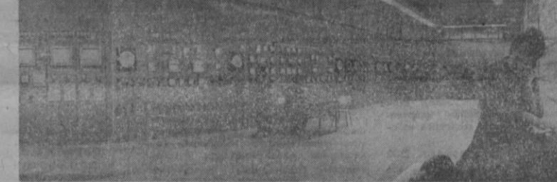
ФАРҒОНА. В. И. Ленин туғилган куннинг 100 йиллигини муносиб совгалар билан кутиб олиш мақсадида социалистик мусобақани икзинг ган қурувчилар азот ўқитилган заводнинг иккинчи навбатини мундарида илгари фойдаланишга топширилади. Янги объект заводида тайёрланадиган маҳсулотини икки баразаар ошириш имконини беради. СУРАТДА: марказий пуялда.

ҚУҚОН. Бу ерда миллий бадий буюмлар тайёрлайдиган фабрика қурилади. Фабрика биносини қуриш 15-трест буюмкорлари коллективизимига қўйилди. Янги корхона ҳар йили уч миллионга қадар сўзана, дўппи, чопон ва бошқа миллий буюмлар тайёрлаб чиқаради. Фабрика келаси йилнинг бошларида дастлабки маҳсулотини беради. ФАРҒОНА. Фарғонадаги нефтин қайта ишловчи завод анида янги бир техника комплекси бунда этилади: мойларни жузда тиник тазалайдиган газ ишлаб чиқарувчи стан блокни фойдаланишга топширилади. Бу блок ишга туширилиши билан корхона Урта Осиёда биринчи бўлиб шимоллий раёнларда ишлатилган совуққа бардош берувчи «жор» сифатли мой ишлаб чиқаришни йўлга қўйди. ҚАРШИ. Қарши пахта заводида ҳар соатда 10 тонна пахта тазалайдиган янги цех фойдаланишга топширилди. Унинг ишга туширилиши билан чиқарилаётган тола сифати анча яхшиланди. ОЛТИАРИҚ. Бу ерда янги пахта заводи ишга тушди. У ҳар йили 40 минг тонна пахта қайта ишлайди. Олтиариқ пахта заводи ҳозир Фарғона областа ишлаб турган пахта заводларининг «тиник» сандир. Бу йил Киров районида янги бир пахта заводи қурила бошлайди. (ЎзТАП).