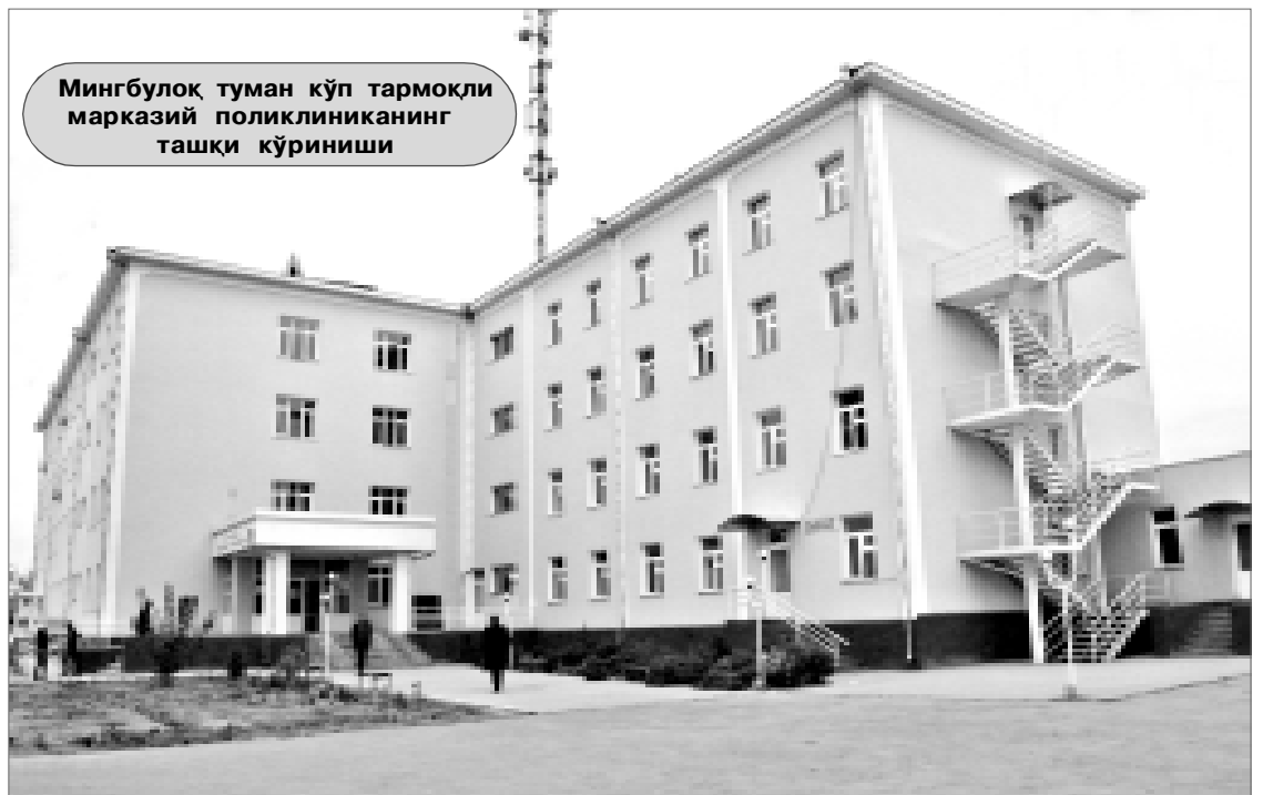
Мингбулоқ туман кўп тармоқли марказий поликлиниканинг ташқи кўриниши

ри, молия бошқармаси ходимлари, вилоят кўп тармоқли ҳамда болалар кўп тармоқли тиббиёт марказлари бош врачлари, бошқарма бош мутахассислари иштирокида лойиҳанинг мақсад ва вазифаларига бағишланган тақдимот семинари бўлиб ўтган эди. Мана шу кунга қадар лойиҳа асосида режалаштирилган мақсадли вазифалар амалга оширилмоқда. Жумладан, жорий йилда вилоят даволаш-профилактика муассасаларига қуйидаги замонавий аппаратуралар ва тиббий асбоб-ускуналар келтирилди.