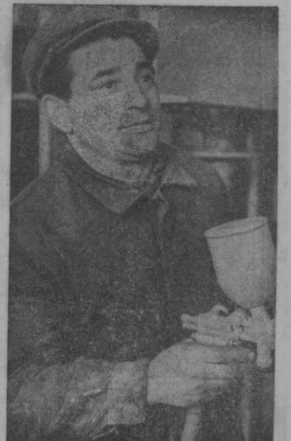
«Узсельхозтехника»нинг Меҳнат Қизил Байроқ орденли Тошкент ремонт-механика заводи ишчилари республикамиз кишлоқ хўжалиги механизаторлари учун трактор, пахта териш машиналари, бульдозер ва экскаваторларнинг ремонт этишга қўлланадиган кўпгина пресслар ишлаб чиқармоқда. Яқинда мана шундай пресслардан анчаси Қарши ва Сирдарё қўлларига ташкил этилган янги хўжалиқларга юборилди.

Кеча Совет Иттифоқида расмий визит билан меҳмон бўлиб турган Жанубий Яман Халқ Республикасининг президенти Ахтан Муҳаммад Ашшаби Бокудан Ватанга жўнаб кетди.