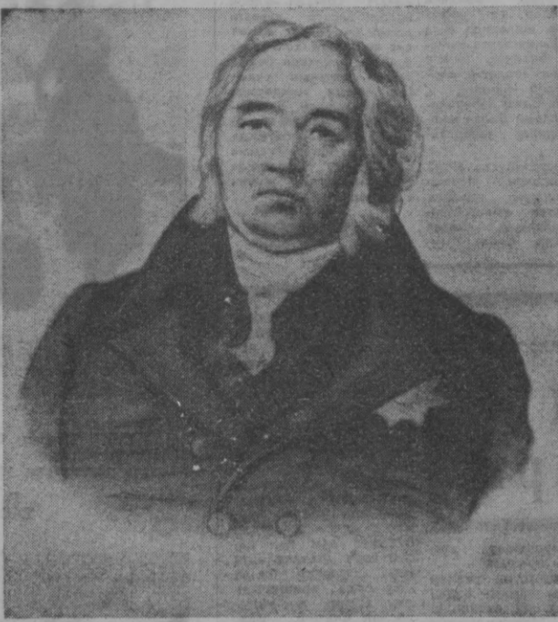
И. А. Крилов.