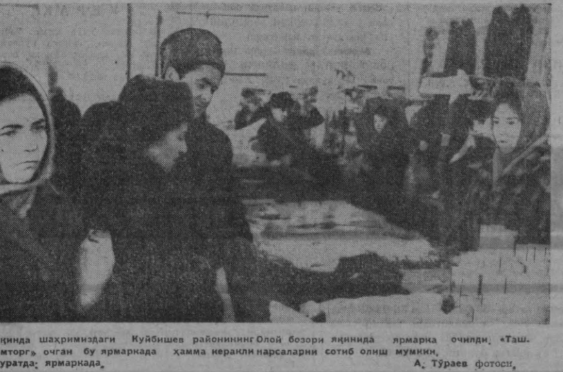
Яқинда шахримиздаги Куйбишев районининг Олой бозори яқинида ярмарка очинди. «Таш. протомга» очган бу ярмаркада ҳамма керакли нарсаларни сотиб олиш мумкин. Суратда: ярмаркада, А. Тўраев фотоси.