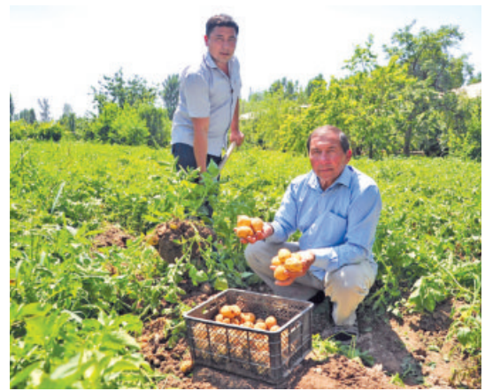
Мажбурий меҳнат, шу жумладан, болалар меҳнати га барҳам берилди.

Аммо қанчалик оғир бўлмасин, қанчалик мураккаб шароит ва тўсиқликлар юзага келмасин, Ўзбекистон етакчилигини қатъий ва мустақкам сиёсий иродаси билан мақсадга эришилди. Бугун мамлакатимизда нафақат валюта бозори эркинлашди, балки ўзбек сўмида халқаро облигацияларни ҳам жойлаштиришга бошланди. Шу кунларга етказганига минг шукр!