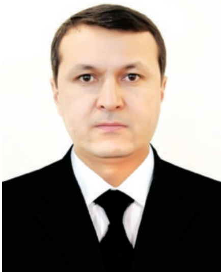
Қаҳрамон САРИЕВ, Қорақалпоғистон Республикаси Вазирлар Кенгаши Раиси