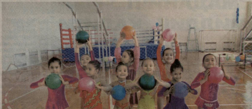
Учтепа туманидаги 26-Болалар ва ўсмирлар спорт мактабида «Отам, онам ва мен — спортчи оила» мусобақалари бўлиб ўтди.