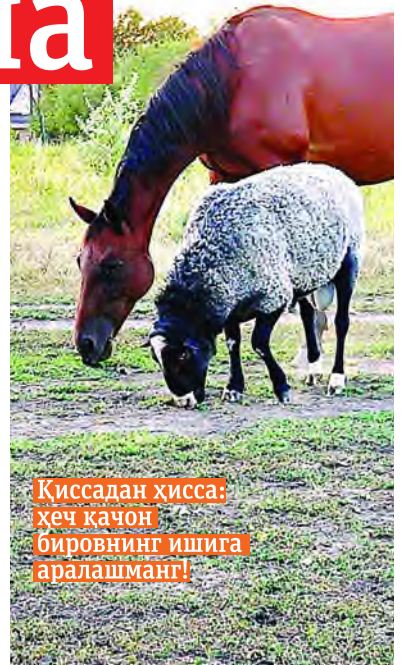
Қиссадан ҳисса: ҳеч қачон бировнинг ишига аралашманг!

— Мўъжиза юз берибди. Бундай бўлиши мумкин эмас эди. Отим тузалибди. Бу воқеани дарҳол байрам қилиш керак. Шу боис қўйни сўямиз! — деди.