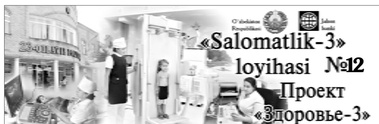
«Salomatlik-3» loyihasi №12 Проект «Здоровье-3»