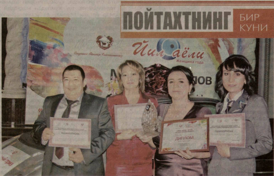
Бугунги кунда ўзбек аёлининг эришаётган муваффақиятлари таҳсинга сазовор. Оила билан бир қаторда ўз кучи, билими ва маҳорати билан юқори чўққиларни забт этаётган аёлларни қўллаб-қувватлашга қаратилган «Йил аёли» миллий танлови мамлакатимизда анъанавий тарзда ўтказиб келинмоқда.