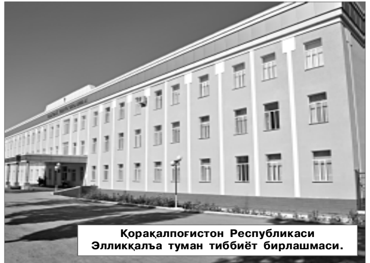
Қорақалпоғистон Республикаси Элликқалъа туман тиббиёт бирлашмаси.

Таъкидлаш керакки, объектларни қуриш ва реконструкция қилишда орттирилган тажриба ҳамда йўл қўйилган айрим хатокамчиликлардан хулоса чиқарилган ҳолда сўнгги йилларда биринчи навбатда лойиҳа-смета ҳужжатларини мукамал ишлаб чиқиш, улар асосида бун-