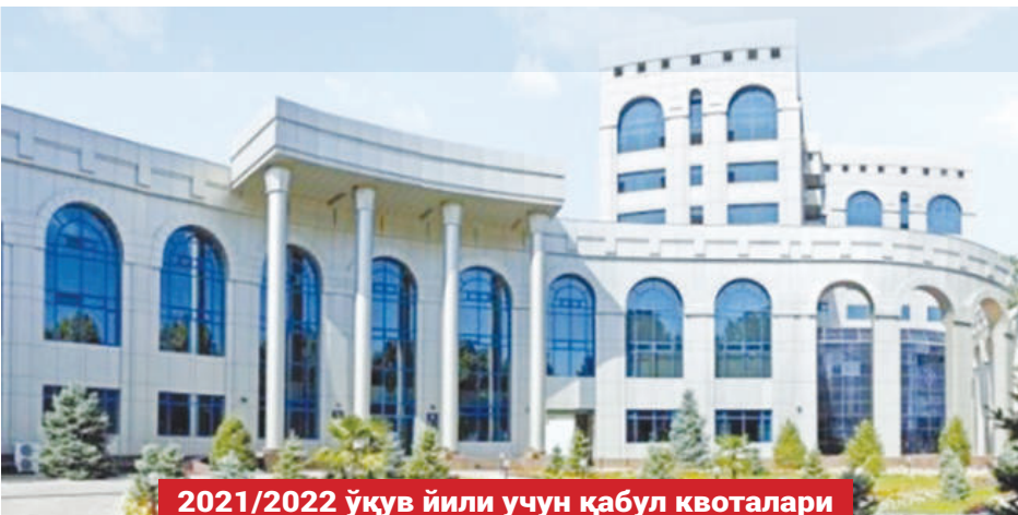
2021/2022 ўқув йили учун қабул квоталари