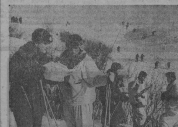
СУРАТДА: ҳаво десантчи машғулот вақтида.