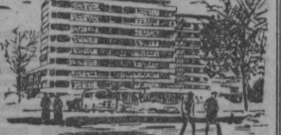
Лекин кўчасидаги янги 9 қаватли уйлар.