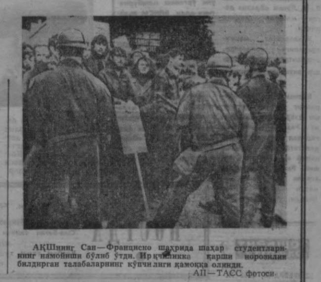
АҚШнинг Сан-Франциско шаҳрида шаҳар студентларининг намоийи бўлиб ўтди. Ирқчиликка қарши норозилик билдирган талабаларнинг кўпчилиги дамоқда олди.

Яқинда Тошкент қишлоқ ҳўжалик институтининг охириги курс студентлари сўнгги давлат иштиқонини муваффақиятли тошириб, ишлаб чиқаришга жўнаб кетдилар. Бу йил институтни олти юздан ортққ йилгитиң таъмомада чиқди. Агрономия факультетининг ўзинингине икки юздан энди қалби олов ёшлар таъмомади. Улар республикамизнинг турли район ва қишлоқларига, колхоз ва совхозларига— ишлаб чиқаришга йўллайма олдилар.