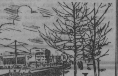
Шота Руставели кўчасида В. Мирошниченко расмлари.