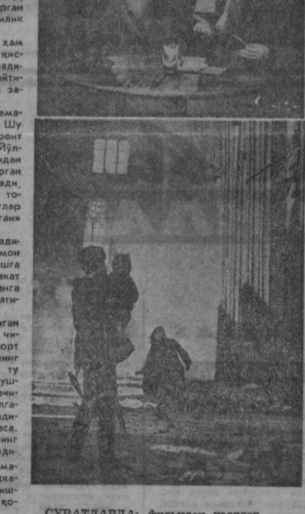
СУРАТЛАРДА: фильмдан кадрлар.

Воқеа Венгриянинг Дунай бўйига жойлашган шаҳарларидан бирида содир бўлади. Чекиновтан немислар дарёни миналаб кетишган. Дарёнинг у бу ерида портлашлар бўлиб турипти. Кемалар, одамлар ҳалок бўлмоқда. Бу қўшиқларимизнинг ҳаракатига тўқнаш қилади. Дарёдан қўшни ва ўқдорлар ўтказиш хавфи. Совет қўмондонлиги олдига яна бир муҳим масала кўндаланг бўлиб туради. У ҳақ бўлса оч ва касалликдан азоб чекаётган шаҳар аҳолисида озқовқат, дори-дармон етказиб бериш масаласи. Кишилар вафот этмоқда, юқумли касаллик тарқалмоқда. Дунай дарёсининг қўйилиш жойида озқовқат, дори-дармон ортган совет кемалари дарё очилишини сабрсизлик билан кутиб турипти. Дарёни минадан тозалаш учун, миналар қўйилган жойлар картасини топиш керак. Қўмондонлик бу вазифани бир гуруҳа мард разведкачиларга топширади. Разведкачилар гуруҳасига «уялов» лақабли донги бутун фронтни туган Курганов бошлик қилади. Лоция. Уни қаердан ахтариш керак? Разведкачилар шу вақтгача ҳалокатга учрамай дарёда бемалол сузиб юрган немисларнинг «Албатрос» кемасидан «тил» олишга аҳд қилдилар. Бу операцияни амалга ошириш учун қаттиқ жанг қилишга тўри келади. Нетижада улар кемачилик идораси махфий бўлимининг бошлиғи фамилиясини билиб олишга муваффақ бўлдилар. Унинг номи Ференц Карлоши экан. Хўш, Карлоши қаерда? Уни қаердан излаш керак? Разведкачиларнинг омади келиб улар Карлошининг турар жойини билдирган Мари исмли