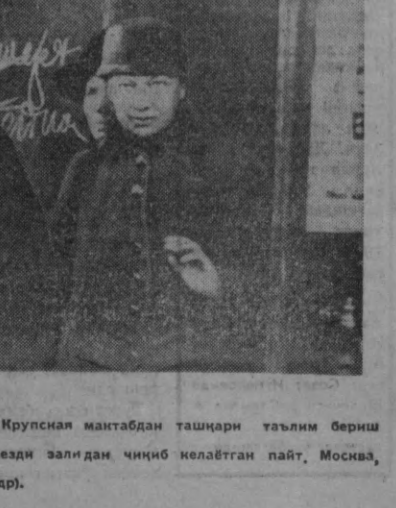
В. И. Ленин ва Н. К. Крупская мактабдан ташқари таълим бериш бўйича I Бутуриессия съезди залидан чиқиб келадиган пайт, Москва, 6 май, 1919 йил (инноқадр).

Н. К. Крупская, менинг неча ёшда оналигимни сўради. Мен 19 ёшга тўлаётганимни айтдим. Шунда у менинг елкамга қўлини қўйди: «Фанат Совет давлатиди, ин ана шундай муваффақиятларга эришиш мумкин. Бу билимнинг маънавий ҳаётини даволати билан боғлашга эришиш мумкин».