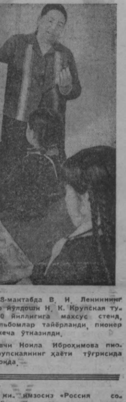
Шахримиздаги 38-мактабда В. И. Лениннинг содиқ дўсти ва умр йўлдоши Н. К. Крупская тузилган кунининг 100 йиллигига махсус стенд, деворий газета, альбомлар тайёрланди, пионер сбири ва махсус меча ўтказилди.

Крупская 1924 йилда РККМнинг VI съездида мутқ сузлаб: «Уз шахсий ҳаётининг жамият ҳаёти билан боғлашга ўрганоғини лозим».— дейди. У В. И. Лениннинг шахсий ҳаётини мисол келтириб, Лениннинг ҳеч қачон, ҳеч вақт шахсий ҳаётини, оилавий ҳаётини жамият ҳаётини ажратмаганини айтди.