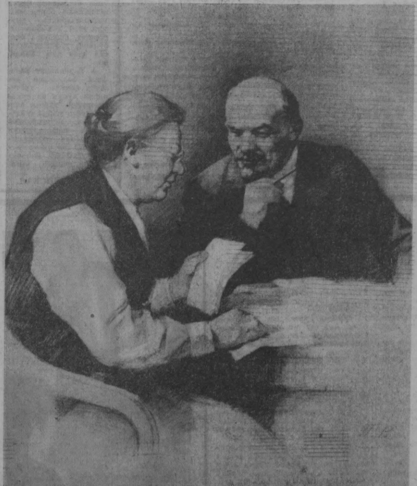
В. И. Ленин ва Н. К. Крупская.

Совет давлати ва Коммунистик партия-нини ийрик арбоби, улуғ Лениннинг сафдоши, яқин дўсти ва рафиқаси Надежда Константиновна Крупская туғилган кунга буун 100 йил тўлди.