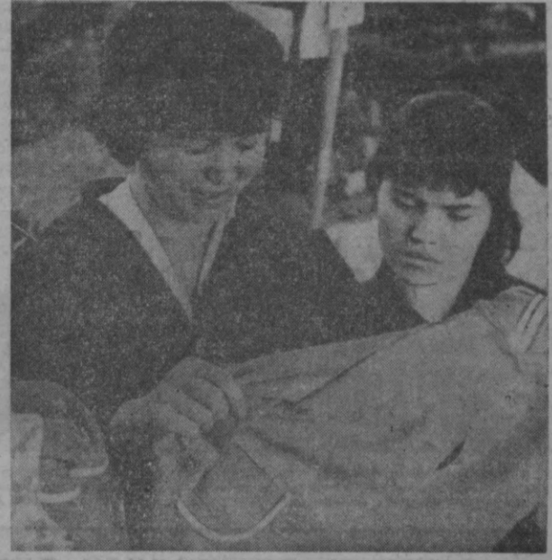
2-тинов фабрикаси мейдаётган баҳор—83 мавсуми учун 132 модель бўйича жуи, ипак ва синтетик галла маладорлар турли хил аёллар кўйлаклари ҳамда қиз болалар мактаб формаларини ишлаб чиқаришга иштирокчилар.

Тошкент шаҳри қурувчилари ва монтажчилари Москва, Ленинград ва қардош иттифоқчи республикалари қурилиш-монтаж ташкилотлари коллективларининг куч-ғайрати билан 1968 йилда 763 миң квадрат метр уй-жой, 23 миң ўқувчи мўлжалланган мактаб бинолари ҳамда 5800 ўришли мактабгача болалар муассасалари, шунингдек, бир қанча маъмурий ва давонаш, маданий-маиший объектлар қурилиб ишга туширилди.