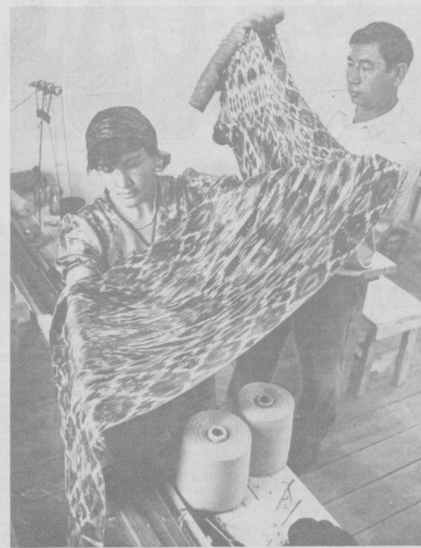
Урта Чирчиқ районидagi Kim Pen Хава номли корпорация республикамизга таъинланган, иқтисодий бақувват ҳужжатлардан...