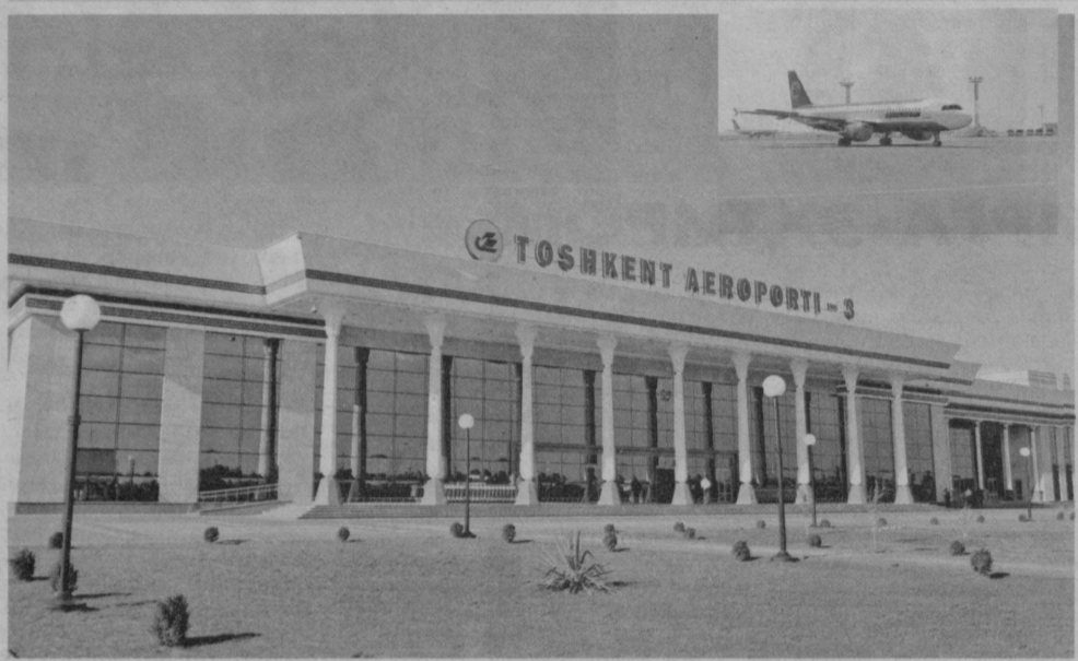
Тошкент аэропорти дунё мамлакатлари нигоҳида ҳам юқори нуфузга эга