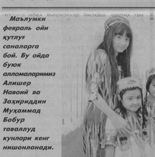
Мазлумки февраль ойи қутлуг саналарга бой. Бу ойда буюк алломаларимиз Алишер Навоий ва Заҳриддин Муҳаммад Бобур таваллуд кунлари кенг нишонланади.

лиларга асосан, биринчи галда, инглиз тили мутахассисларининг малакасини ошириш ишларини йўлга қўвилади. Кейинги вазифининг немиш, француз ва испан тиллари бўйича ўқитувчилар малакасини оширишдир. Жумладан, ўч босқичли таълим тизимидаги ўқитувчилар малакасини каскад усулида, замонавий методика асосида шакллантирамиз. Шу тариха мазкур жараён август ойигача давом этади. Хусусан, жорий йил февраль ойида Қоракалпоғистон Республикаси ва вилоятлардан келган 250 нафардан зиёд чет тили ўқитувчилари ЎзДжТУда малака оширишди. Хорижий ҳамкасблар билан ҳамкорликда тўзилган, ўқувчи ҳамда талабаларнинг билим ва малакаларини умумевропа стандартлари бўйича баҳолаш тизимига яқинлаштирилган ўқув дастури асосида таъбир ортиртган бу мутахассислар кейинги босқичда жойлардаги бошқа ўқитувчилар учун машгулотлар ўтади.